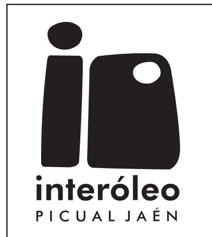
VERSIÓN PRINCIPAL 1 TINTA