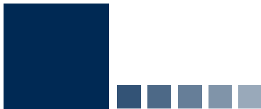
TINTA DIRECTA - PANTONE 539 CV