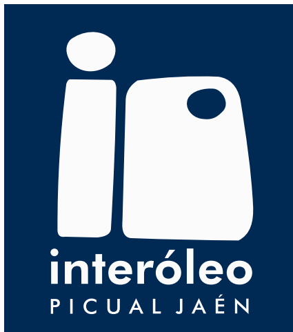
VERSIÓN PRINCIPAL SOBRE PANTONE 539CV