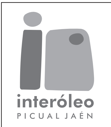
VERSIÓN PRINCIPAL ESCALA DE GRISES