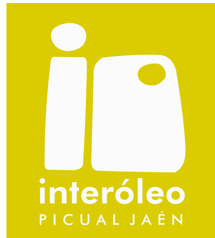
VERSIÓN PRINCIPAL SOBRE PANTONE 103CV