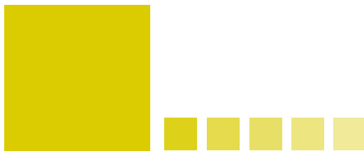
TINTA DIRECTA - PANTONE 103 CV